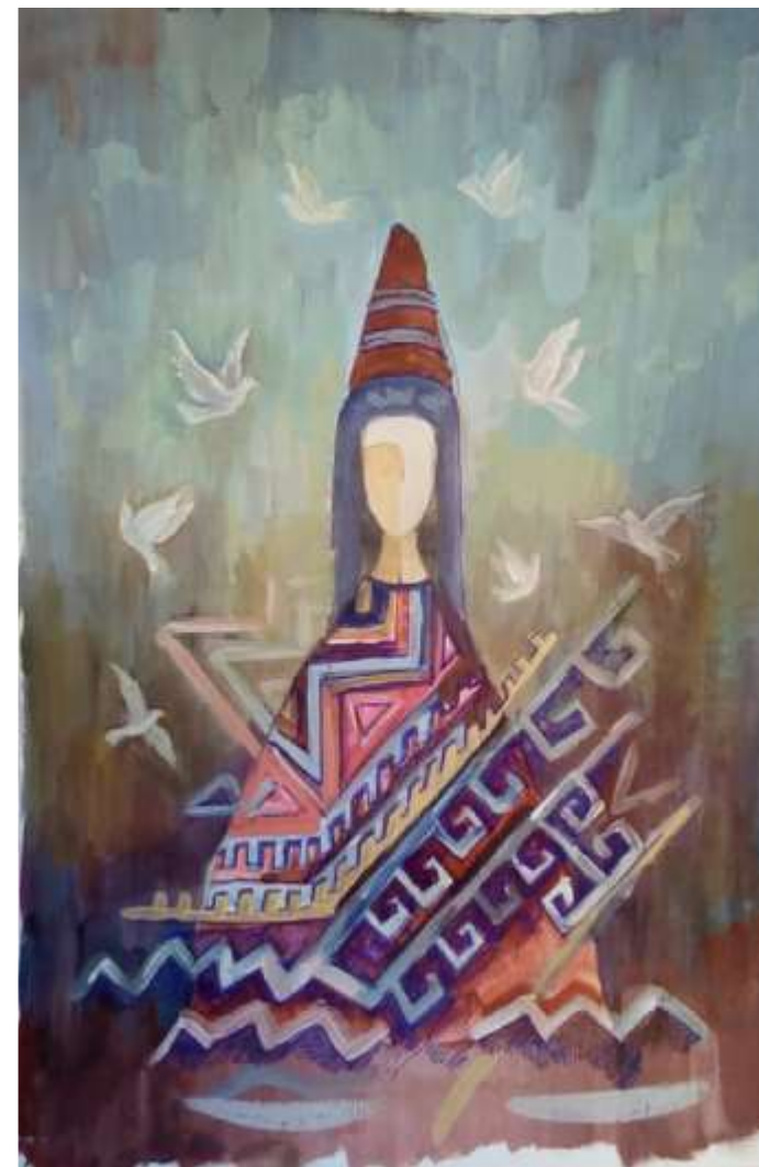
«Көңіл құсы» киізден панносына таңдалған нобай. Сырмақ техникасы бойынша басылатын киіз.