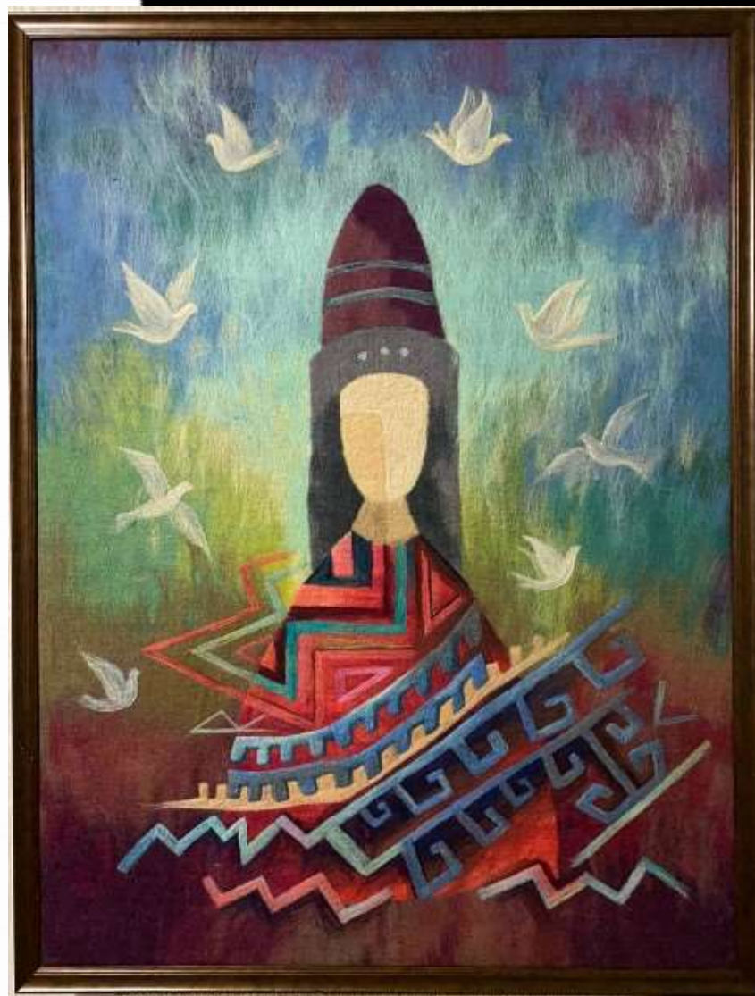
«Көңіл қусы» киізден панно